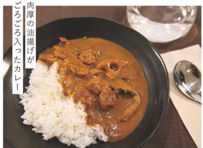
肉厚の油揚げが ごろごろ入ったカレー