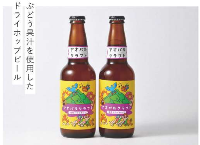
ぶどう果汁を使用した ドライホップビール