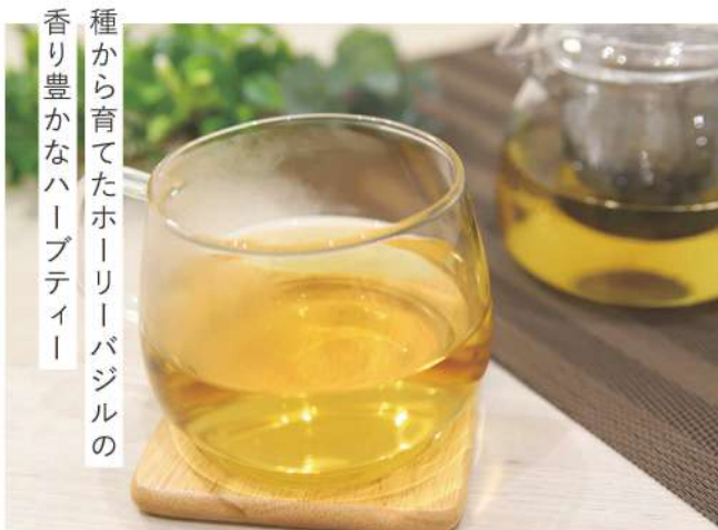
種から育てたホーリーバジルの 香り豊かなハーブティー