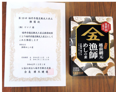
福井県優良観光土産品を受賞した「漁師めしの素」

また、より鮮度の良い魚をお届けするために自ら巻網事業・定置網業にも参入。高鮮度・高品質の魚を使った、数多くの商品は福井だけに留まらず、日本全国へ流通しています。