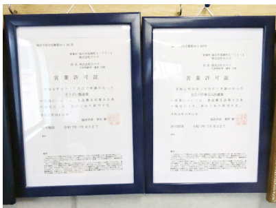
補助金を活用して取得した許可証

商 工工会を通じて補助金を活用し、自社の加工所に間仕切り・ドアを導入することで、そうざい製造業・冷凍食品業の営業許可を取得。