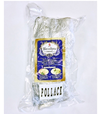
国内唯一のバカリヤウ

ヨ ーロッパやブラジルで親しまれている、塩漬けしたタラを天日干しした保存食『バカリヤウ』を初めて東京で見たことがきっかけで生産に挑戦されたそうです。実際にブラジル人に食べてもらうなど、3年以上研究を重ね試行錯誤の末、国内で唯一の生産に成功。何事にも諦めずに取り組む姿勢が今の株式会社ヤマゴさんの土台となっていると感じました。