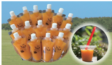
飲むみかんゼリー15個入り