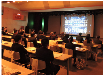
◀オープニングセレモニーでの スライド上映