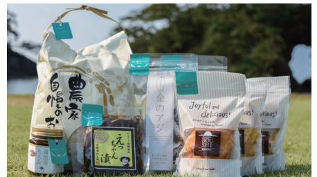
「青い海プレミアム」 うまいもん集まんな〜れ