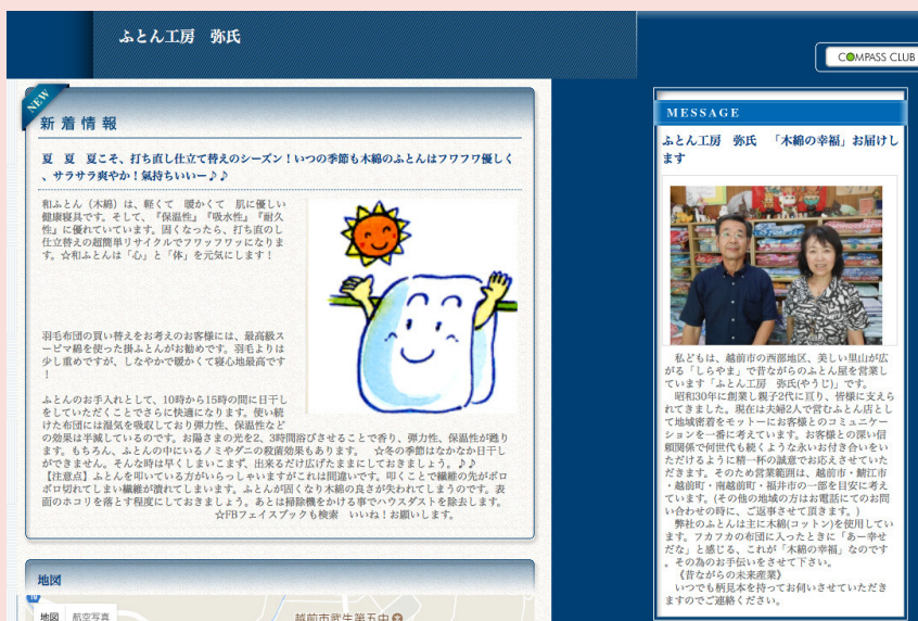
【ホームページの一部】

商工会の支援を受け、平成21年に100万会員ネットワークを活用したHPを作成しました。新着情報などの発信は自分で行っています。