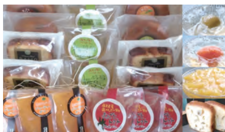
豆腐屋さんの豆乳焼きドーナツ・ 梅酒ケーキと福井県産ゼリー詰合せ