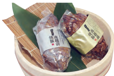
南越前 焼豚 金銀セット

キャンペーン対象 平成27年8月26日～12月21日のご契約受付分 プレゼント商品発送 第1回 8月26日～10月23日ご契約分 ⇒ 平成27年12月下旬(予定) 第2回 10月26日～12月21日ご契約分 ⇒ 平成28年1月下旬(予定)