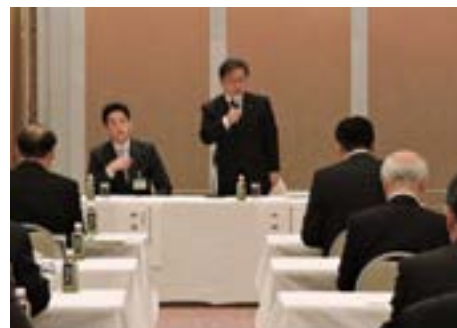
県との意思交換会模様