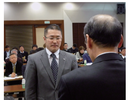
(認証企業紹介 P2～P5参照)

同制度は、日本経営品質賞に準拠した県連合会独自の基準により、企業の「強み」や「弱み」を経営に関する8つの分野で評価するシステムで、総合的にAA・A・B・C・Dの五段階で判定するもの。本年度は、優秀賞(A認証)4企業、奨励賞(B認証)31企業の合計35企業を認証しました。